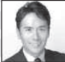
US Remac, Inc. President & CEO