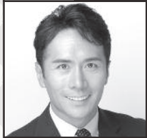
US Remac, Inc. President & CEO