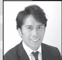
US Remac, Inc. President & CEO