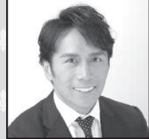
US Remac, Inc. President & CEO